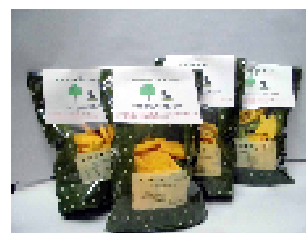
しらかみ手作りクッキー

☆予約が必要なお食事の申込み、各商品のご購入、サービスのご利用については、スタッフへお声がけください☆