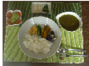
白神グリーンカレー