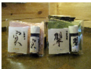
アロマオイル (実・翠)